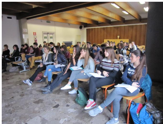
Il pubblico di studenti